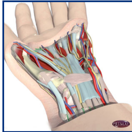
Fig.1 Carpaal tunnel